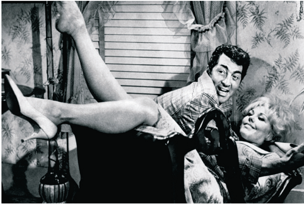
קים נובאק. חגיגה לחובבי נוסטלגיה

סינמטק הרצליה עורך במהלך ינואר מחווה לסרטי בילי וויילדר - אחד הבמאים האהובים והשנונים בתולדות הקולנוע העולמי